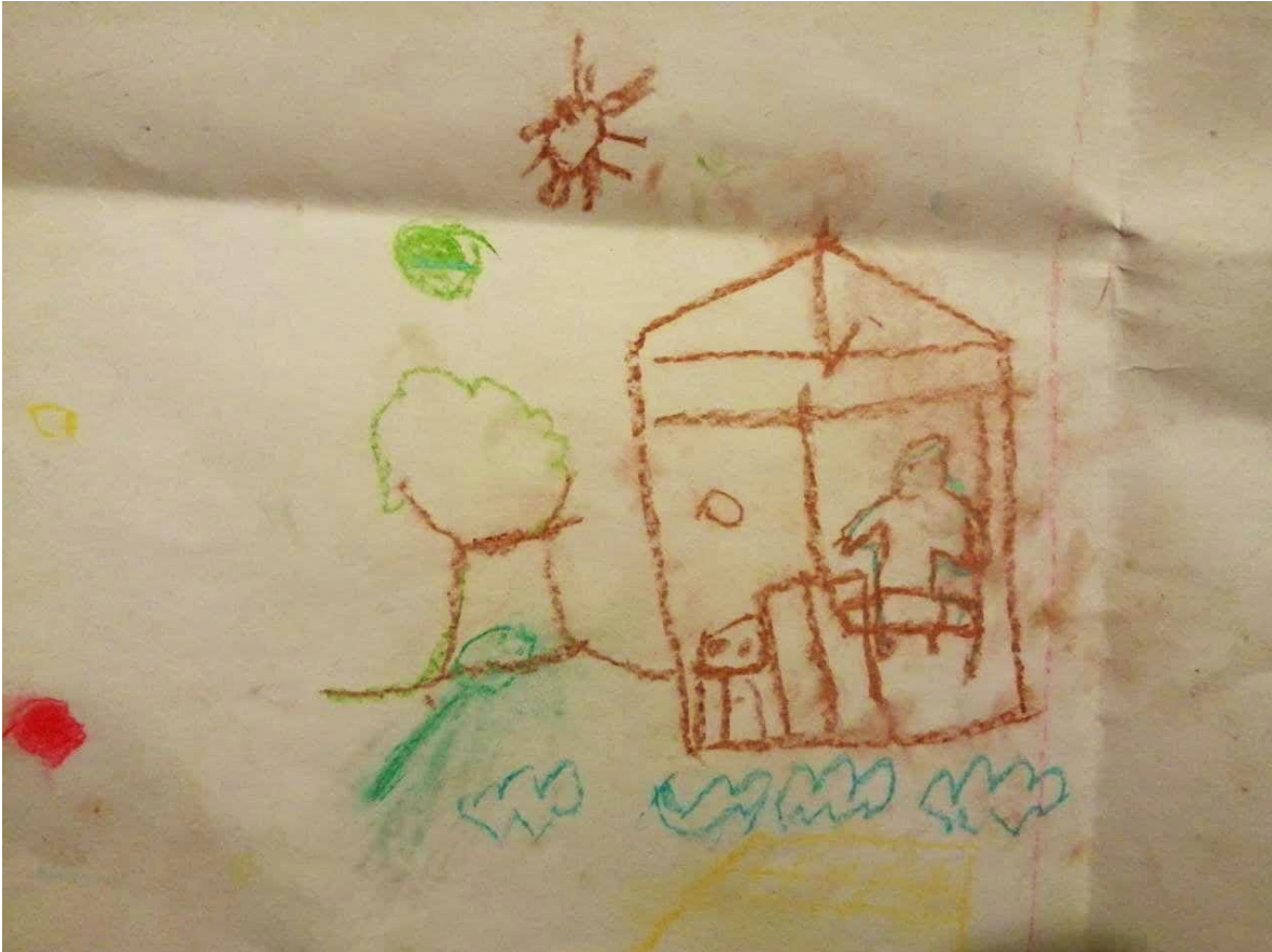
22 de febrero del 2021. Dibujos elaborados durante los talleres de apoyo psicológico con Infancias indígenas de la comunidad de Tula Guerrero.