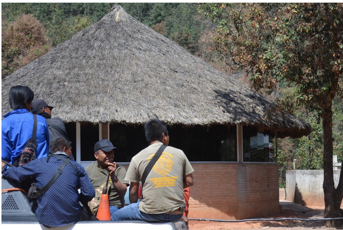
22 de febrero del 2021. Puestos de vigilancia, barricadas, rondines y puestos de control de la CRAC-PC-PF para garantizar la seguridad de los pueblos Nahua de Chilapa de Álvarez y José Joaquín de Herrera, cercados por el grupo criminal "Los Ardillos".

La necesidad de los hombres de participar en las guardias de la policía comunitaria y las heridas de bala son otros motivos que complican en igual medida, la posibilidad de trabajar para comercializar o adquirir alimentos de autoconsumo para sus familias.