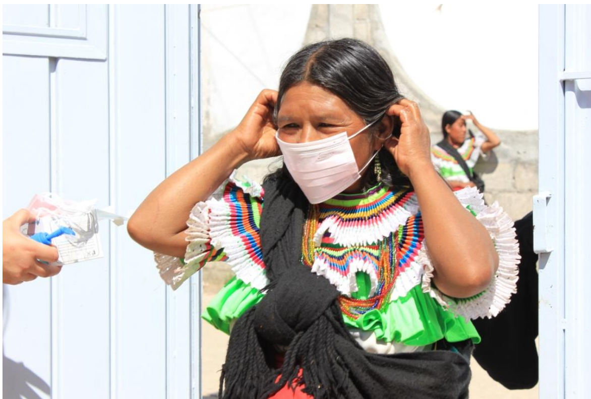
Debido al contexto sanitario por COVID-19 se implementaron los protocolos sugeridos por la Organización Mundial de la Salud.

El trabajo con las infancias fue lúdico y los resultados de tipo cualitativo. En estas actividades participaron 28 niños y niñas de entre 7 y 12 años de las comunidades de Alcozacán, Tula Guerrero, San Jerónimo Palantla, Xicotlán y Acahuehuetlán. El objetivo del acompañamiento psicosocial a niños y niñas en contextos de violencia es acercarnos a su pensar, sentir y hacer. Algunas preguntas eje de trabajo fueron ¿Cómo es que perciben a los adultos y su entorno? ¿Qué explicación se dan sobre lo que pasa? ¿Cómo ha cambiado su vida, su cuerpo? ¿Cuál es su lucha? ¿Qué quieren ellos y ellas?