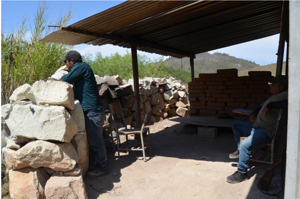
22 de febrero del 2021. La CRAC-PC-PF resguarda a la comunidad de Tula Guerrero, en alerta permanente ya que los ataques armados sorpresivos rebasan la decena y las autoridades locales, estatales y federales no intervienen cuando "Los Ardillos" inician las balaceras.