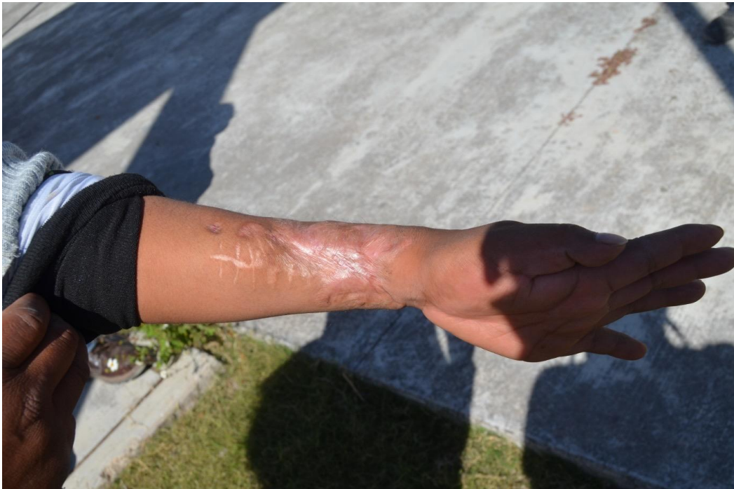
21 de febrero del 2021. Indígena Nahua de la comunidad de Tula Guerrero, muestra la herida a consecuencia de una bala, en uno de los más de nueve ataques armados que ha recibido esta comunidad por parte del grupo criminal "Los Ardillos".