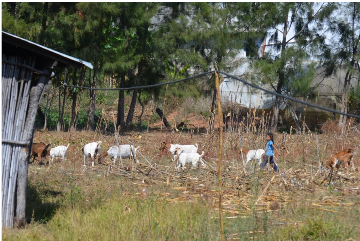
22 de febrero del 2021. Las infancias realizan sus actividades como indígenas y campesinos Nahua en un contexto de grave violencia, sin escuelas, sin internet y sin apoyo de ninguno de los tres niveles de gobierno.

se realizan con el objetivo de contar con tierra para realizar actividades vinculadas al narcotráfico. El castigo por no acatar las órdenes de estos grupos es la persecución e intimidación. De esta forma orillan a la población a dejar sus tierras, su vida y con ello a abandonar su identidad comunitaria.