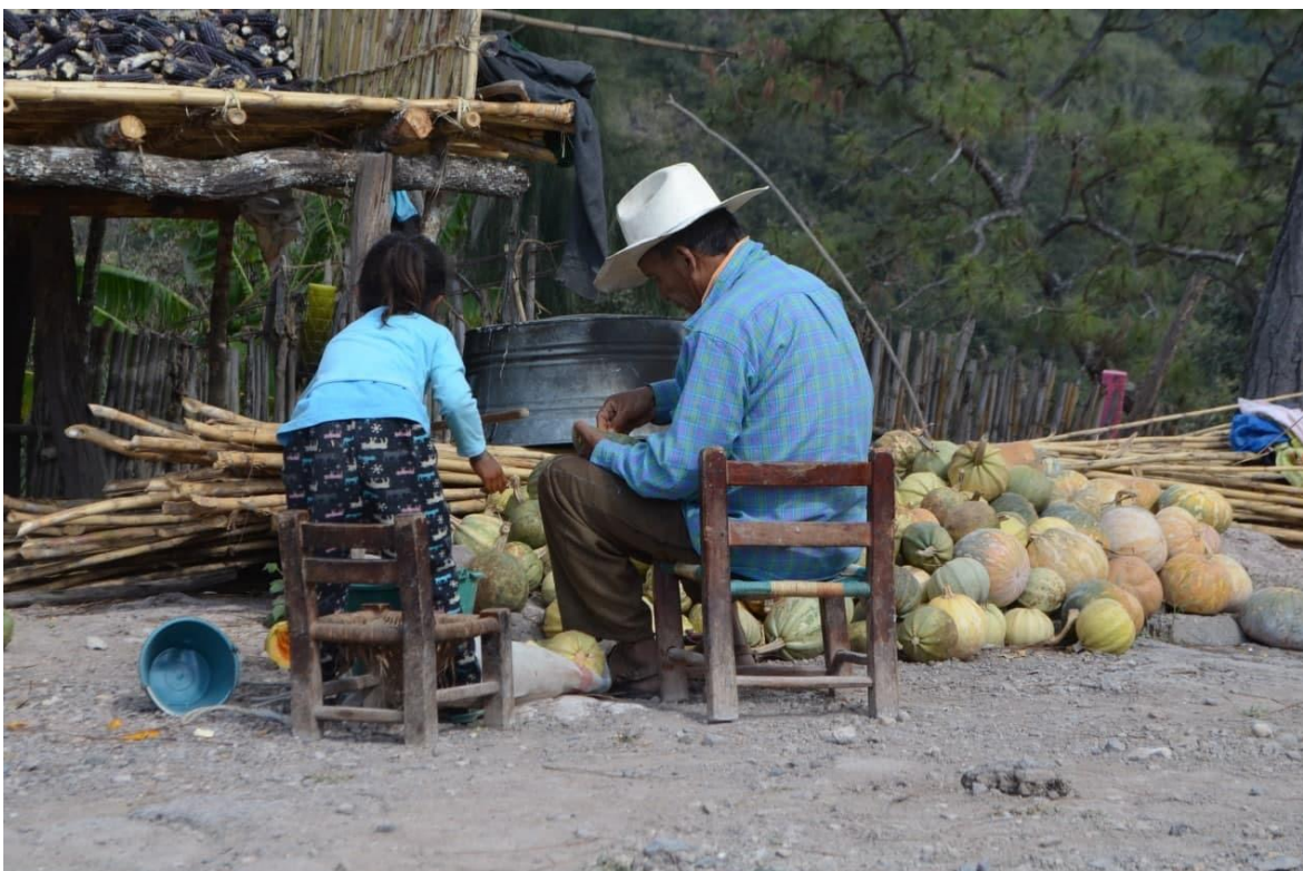
20 de diciembre del 2017. Chilapa de Álvarez. Abuelo y nieta trabajan para desgranar el maíz y limpiar la calabaza de la milpa que se cosecho.

En este marco, vale detallar la dinámica laboral de las comunidades de La Montaña Baja de Guerrero. El trabajo agrícola y artesanal es el más importante; tienen acceso a tierras de cultivo propias, prestadas o rentadas para la agricultura de autoconsumo y venta; las mujeres son las encargadas de resolver las tareas en el hogar, bordan, tejen palma ya sea para petate y/o cintas que son trenzas de tiras de palma que se utilizan en la creación de diferentes objetos de cestería y los hombres pueden migrar y trabajar como jornaleros, jardineros, albañiles o peones en cultivos; algunos son comerciantes.