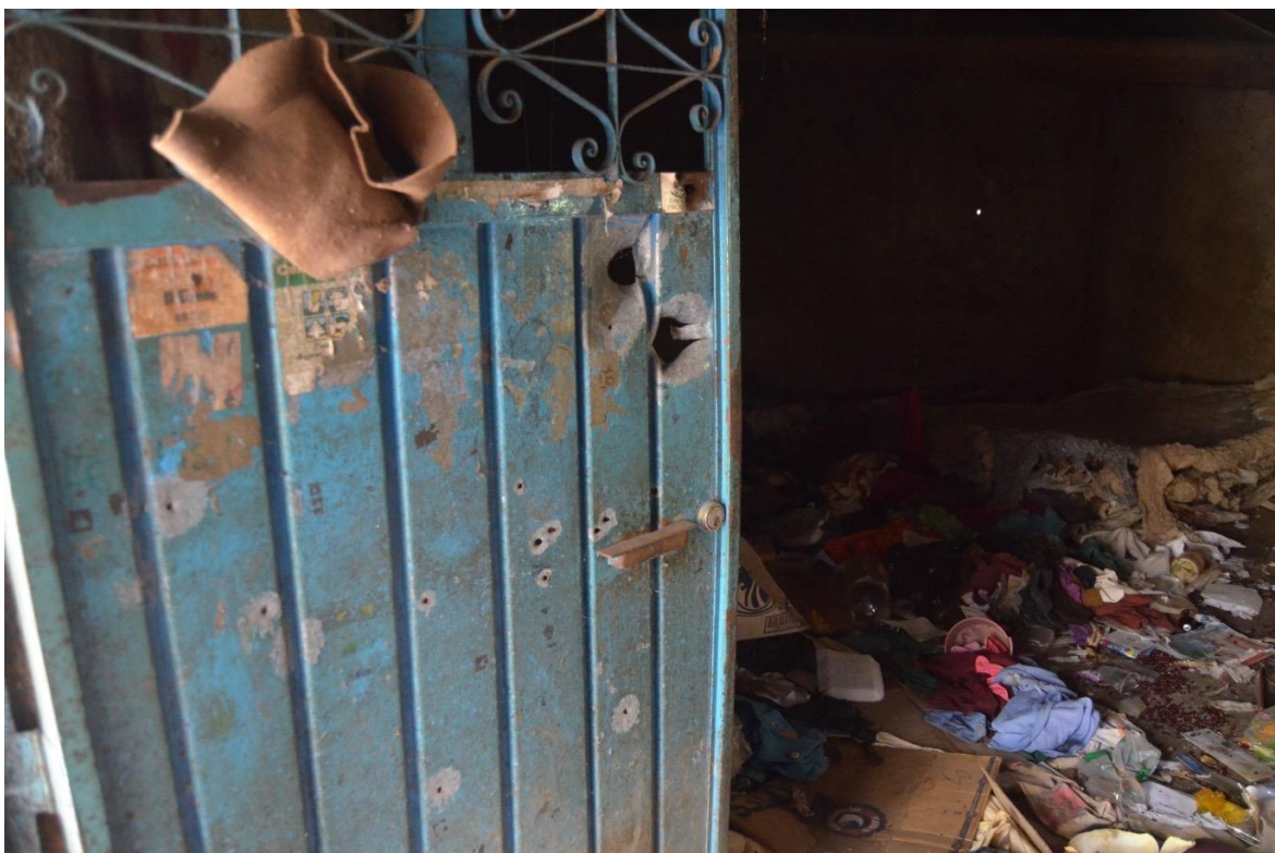
22 de febrero del 2021. Desplazamiento forzado de la población indígena Nahua de Paraíso de Tepila. En la imagen domicilios violentados por parte del grupo criminal "Los Ardillos".

Como parte de su plan para cercar a las comunidades, “Los Ardillos” instalaron un retén y un campamento sobre la carretera que atraviesa dicha comunidad destacamentando alrededor de 150 Ardillos. Desde dicho punto se cortan las comunicaciones de las comunidades de Zacapexco y Rincón de Chautla.