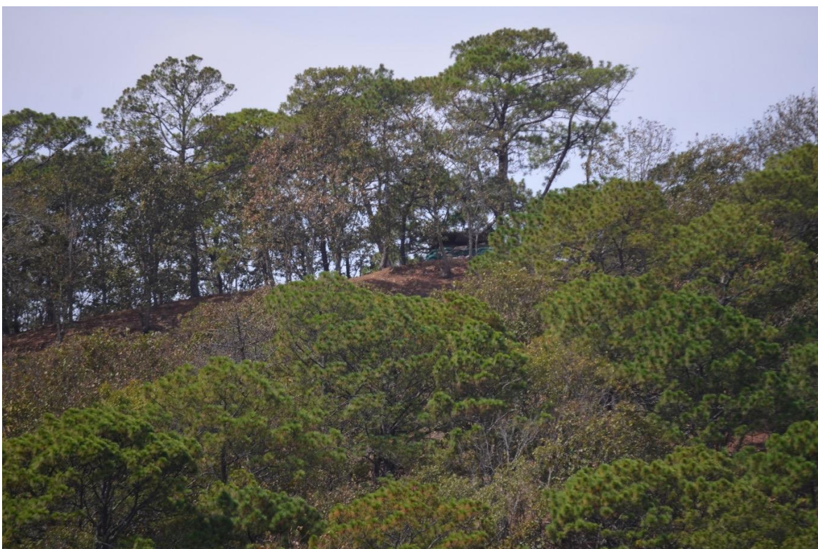
22 de febrero del 2021. Frente a la comunidad de Tula Guerrero, se aprecian las barricadas y puestos de control desde donde el grupo criminal "Los Ardillos" los ataca sistemáticamente con armas de fuego. Fotografía:

Otro caso de esta comunidad en el cual se violentan los Artículos 5, 9, 13 y 17 de la DUDH, es el caso de “P”, una mujer que lleva por lo menos dos años sin tener contacto físico con su familia originaria de la comunidad de Colotepec. Ella tomo la decisión de irse a vivir a Tula Guerrero y formar ahí su familia, esto provocó que las personas que están con “Los Ardillos” la amenazaran y a su familia en Colotepec. Las amenazas dirigidas a su familia refieren a quitarles sus tierras o desaparecerlos/asesinarlos, si es que “Los Ardillos” se llegan a enterar de que tienen contacto de cualquier forma con ella. Ya en una ocasión han cumplido sus amenazas asesinando a su cuñado en Colotepec.