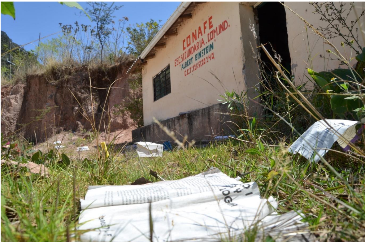
22 de febrero del 2021. Huellas de la violencia y de las graves violaciones a los derechos humanos por parte del grupo criminal "Los Ardillos" en la Escuela Secundaria "Albert Einstein" en la comunidad indígena Nahua desplazada de Paraíso de Tepila.

El derecho a la Educación se encuentra protegido por leyes y acuerdos nacionales e internacionales signados por México. En la Constitución Política de los Estados Unidos Mexicanos en su Artículo tercero, en la Declaración de los Derechos del Niño, proclamada por la Asamblea General de la ONU (1959) en el séptimo principio, en la Convención sobre los Derechos del Niño (1989) en el Artículo 28, así como en la Ley General de los Derechos de Niñas, Niños y Adolescentes (2014) en el Artículo 13 y 57. En todos los documentos mencionados, se reafirma el compromiso mundial por brindar educación a niñas, niños y adolescentes.