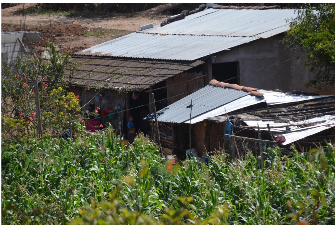
22 de febrero del 2021. Infancias indígenas de la comunidad de Tula Guerrero, viviendo en medio de la violencia desatada por el grupo criminal "Los Ardillos".

Durante las actividades fue recurrente que los infantes hicieran referencia a la ausencia de sus padres. Algunos de ellos y de ellas comentaban no saber dónde está su papá, otros tenían presente que su padre o madre habían sido asesinados. Las principales emociones observadas que emanan ante esa ausencia eran la tristeza y el enojo. Un niño compartió que su papá estaba en la cárcel por un crimen que no cometió y que lo extrañaba mucho. Otra niña dijo que su papá no estaba porque se había ido a Sonora a trabajar la tierra, pero que lo extrañaba y que estaba enojada ante tal situación.