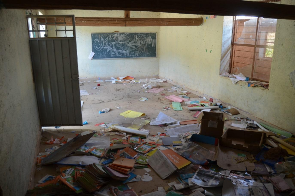
22 de febrero del 2021. Huellas de la violencia y de las graves violaciones a los derechos humanos por parte del grupo criminal "Los Ardillos" en el interior de la Escuela Primaria "Fundadores del 92" en la comunidad indígena Nahua desplazada de Paraíso de Tepila.