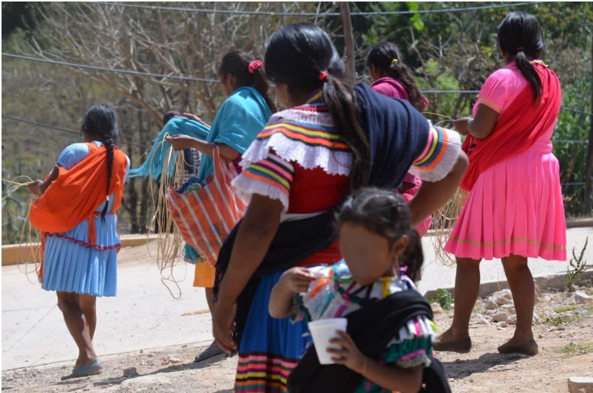
23 de febrero del 2021. Mujeres indígenas Nahua con su traje tradicional caminan y tejen mientras platican.

La migración de los habitantes de las comunidades muchas veces son resultado directo de las amenazas que hace el grupo delictivo “Los Ardillos”, así lo compartió “CN”: