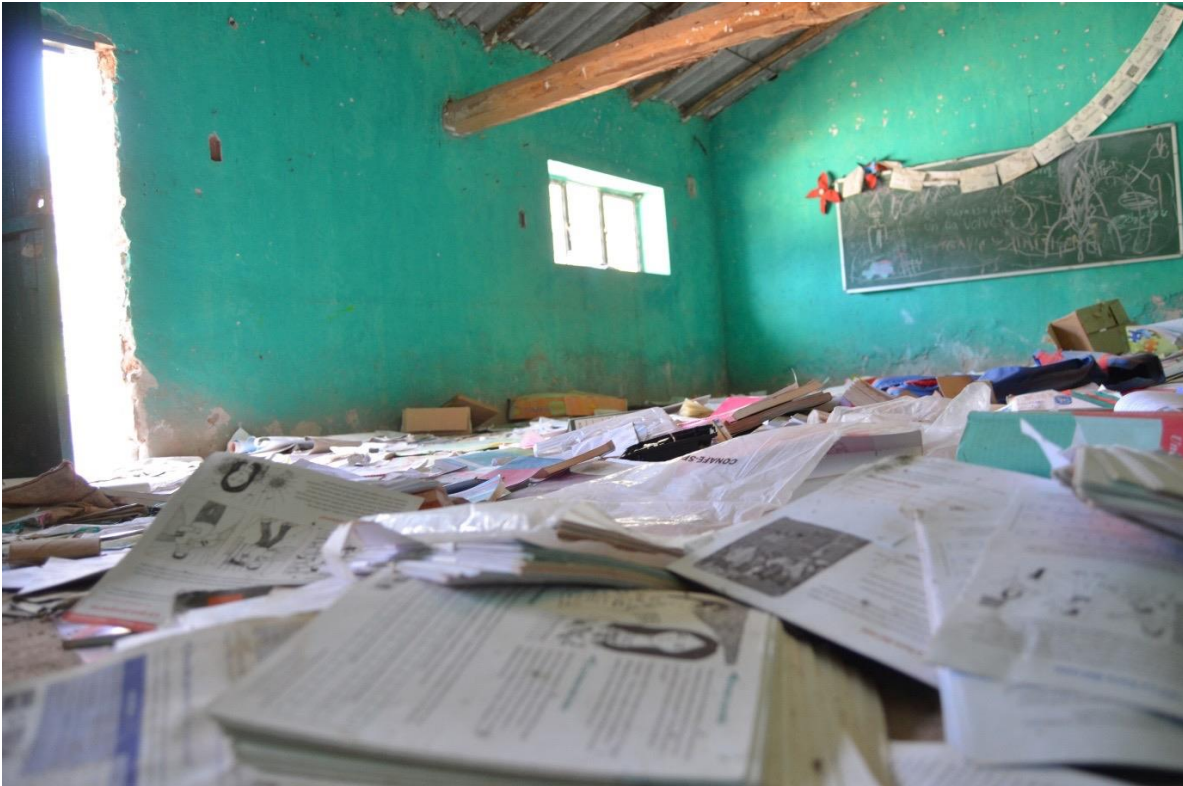
22 de febrero del 2021. Huellas de la violencia y de las graves violaciones a los derechos humanos por parte del grupo criminal "Los Ardillos" en el interior de la Escuela Secundaria "Albert Einstein" en la comunidad indígena Nahua desplazada de Paraíso de Tepila.

Algunos maestros que ponen por encima de su miedo la enseñanza, se ven impedidos por retenes improvisados, intersecciones en el camino, falta de luz, falta de internet e incluso las experiencias de ver a “Los Ardillos” fuera de las escuelas esperando a los estudiantes o a sus familiares para actuar como se menciona en el siguiente testimonio.